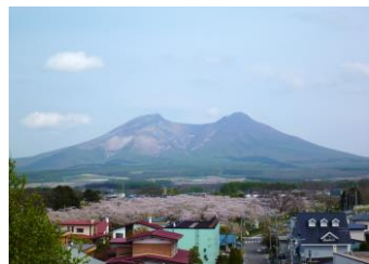
森町道の駅から望む駒ヶ岳

大沼公園から見る、切り立った剣ヶ峰となだらかな砂原岳は、眺める場所により全く別の形に見えます。ドライブや列車で山を一周することも出来るので、見え方の違いを楽しんでみては。