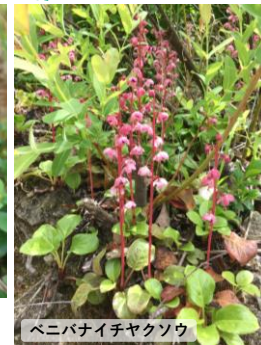
ベニバナイチヤクソウ