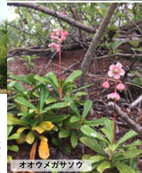
オオウメガサソウ