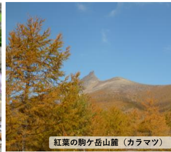
紅葉の駒ヶ岳山麓(カラマツ)