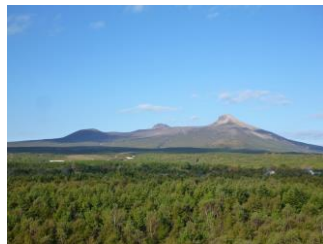
鹿部町本別から望む駒ヶ岳