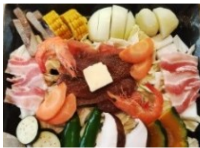
Salmon chanchan-yaki, Sashimi