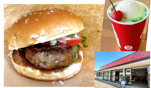
Onuma beef hamburgers