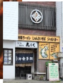
Udon and soba noodles, set meals