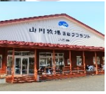
Fresh milk, Soft ice cream, Beef curry