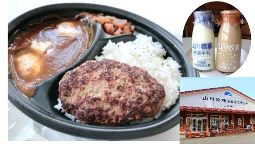
Fresh milk, Soft ice cream, Beef curry