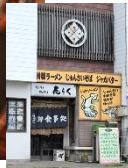
Udon and soba noodles, set meals