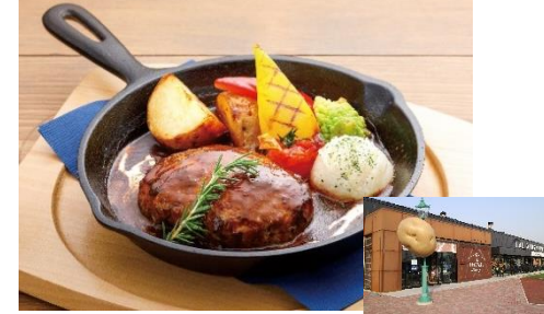
Onuma beef Hamburger steaks, pastas