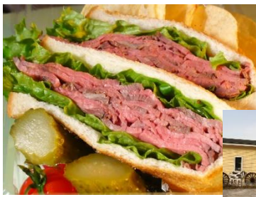
Roast beef Sandwich, Beef Curry