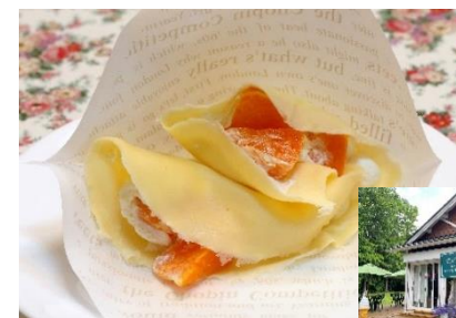
Crepes, Breakfast, Lunch