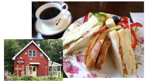
Sandwiches, Cakes, Coffee and Tea