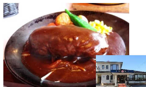
Hamburger steaks, Wagyu steaks