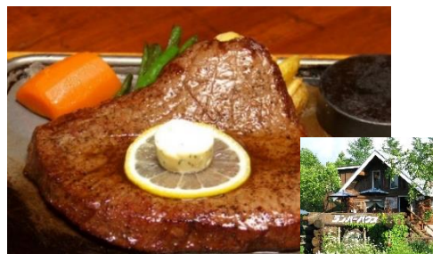
Onuma beef steaks