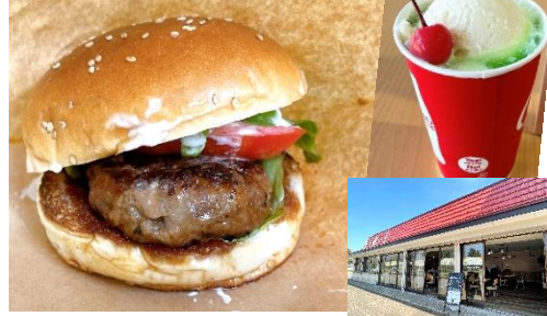
Onuma beef hamburgers