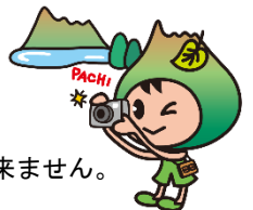
七飯町観光PRキャラクター ポロトくん

★応募方法★ デジタル撮影された作品を 六ツ切 (203x254)または A4 (210x297)に プリントアウト し、 必要事項を記入した応募票を写真裏面に貼付 して、七飯大沼国際観光コンベンション協会宛に 郵送 もしくは、 直接お持ちください 。(家庭用インクジェットプリンタ可)。