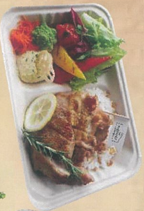
道産 鶏ももステーキ