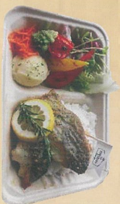
白身魚のムニエル (バジルソース)