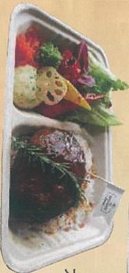
大沼牛ハンバーグ