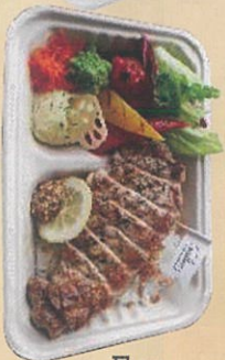
道産 ひこま豚 ロースステーキ