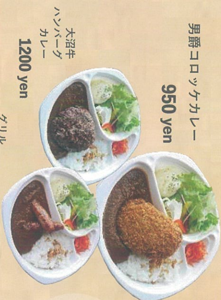
大沼牛 ハンバーグ カレー