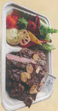
牛サーロイン ステーキ